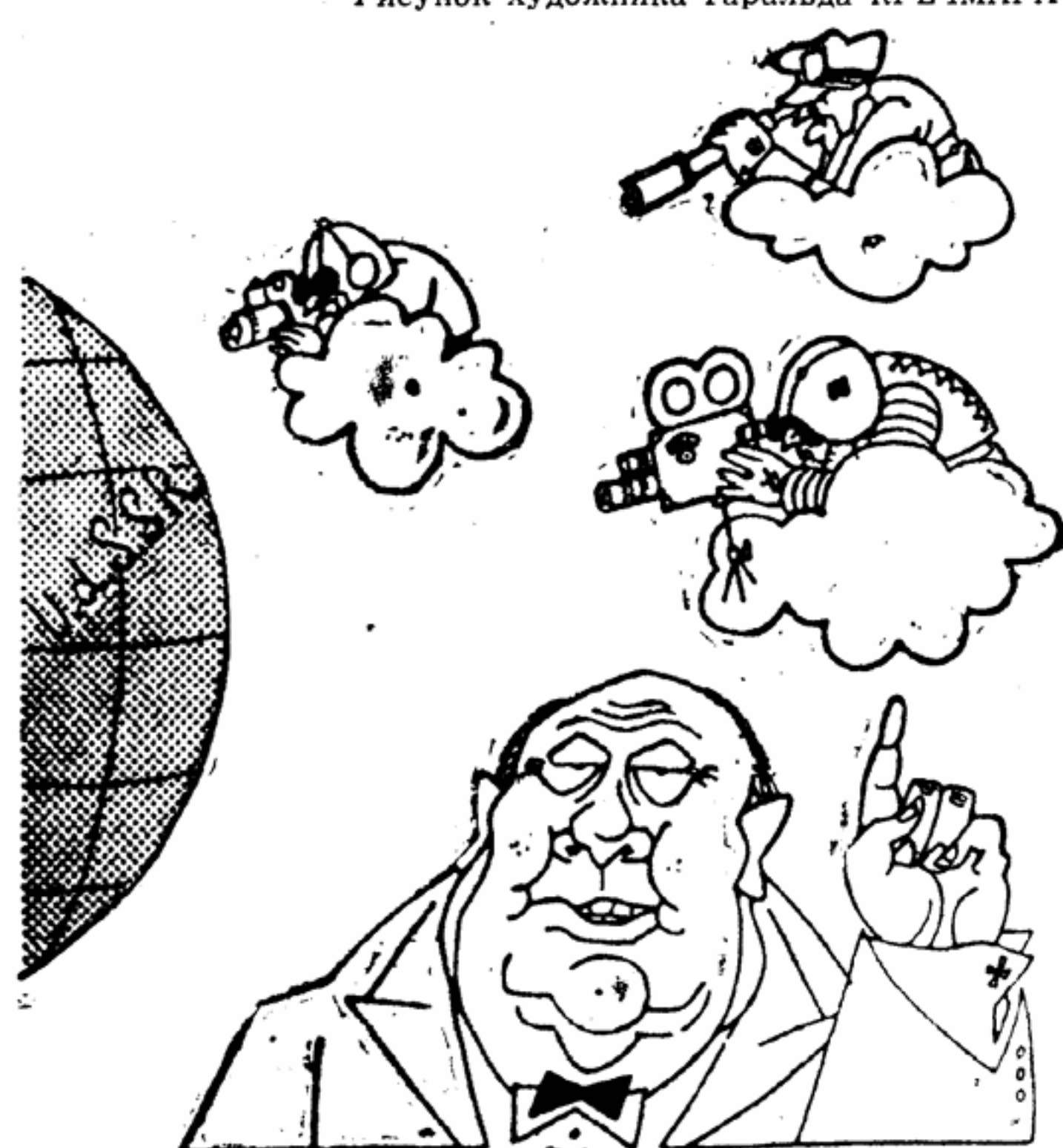
Идеолог «открытого неба»: — Небо должно быть открытым для всех! Но не для русских, конечно, они ведь авиисты! Рисунок художника Луиса РАУВОЛЬФА