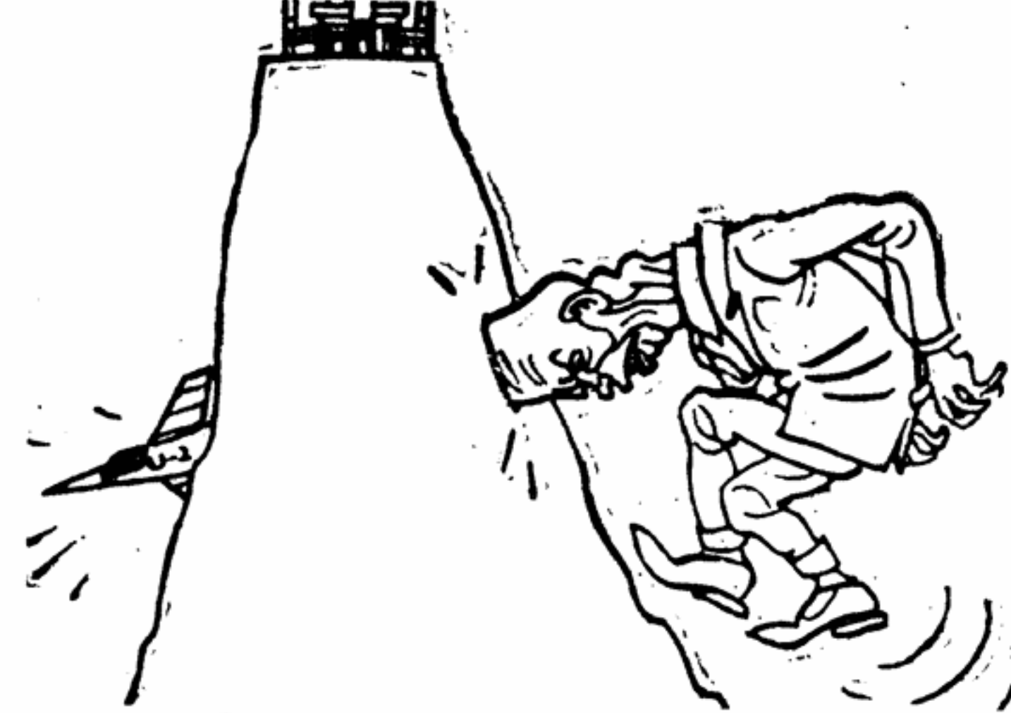
Он торпедировал совещание в верхах Рисунок художника Лео ХААСА