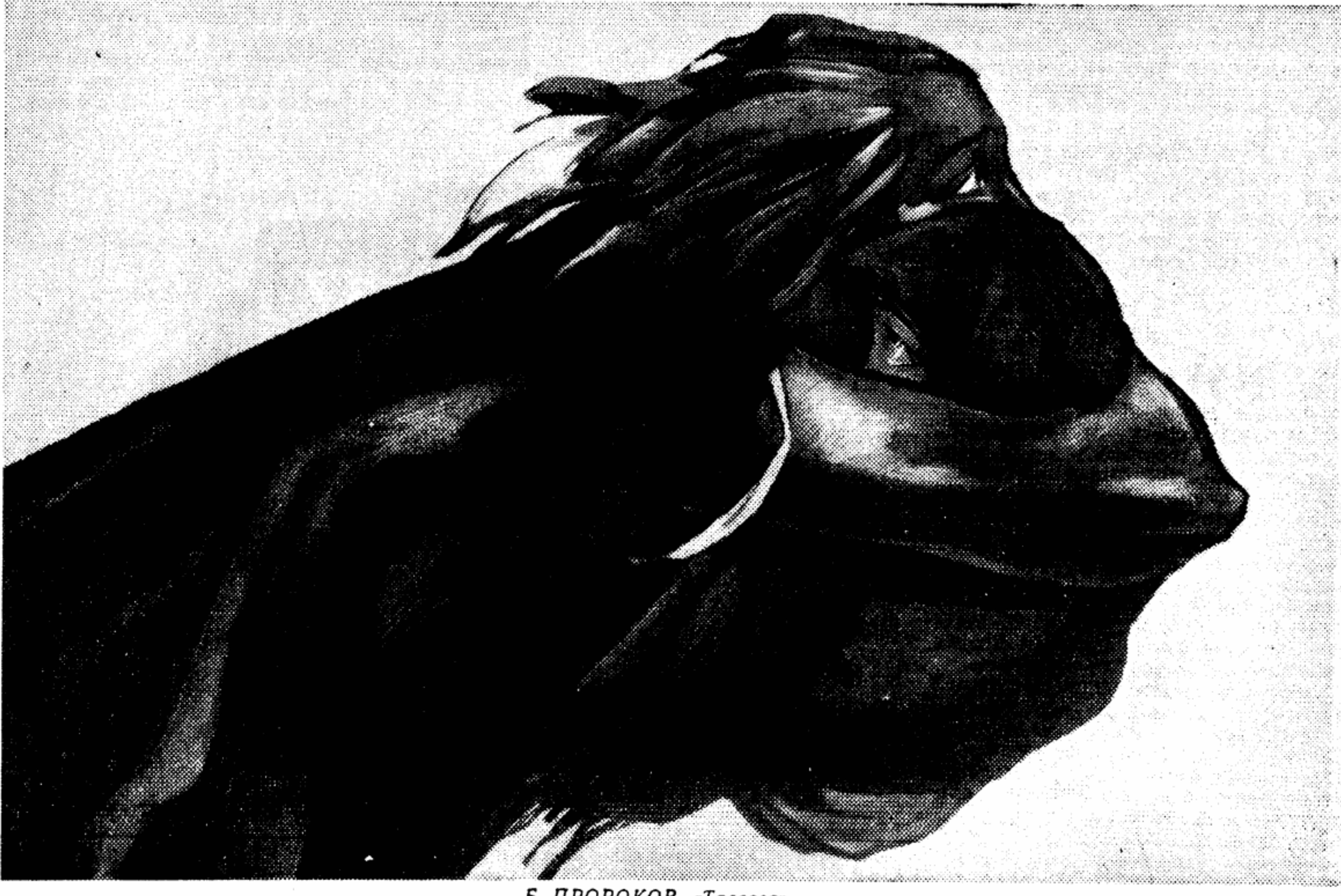
Б. ПРОРОКОВ. «Тревога».

Что же касается истинного человеческого счастья, то в это понятие входит и наша способность воспринимать, наслаждаться, расширять свой духовный мир и общественные интересы теми образами, которые создает поэт. Хочется, чтобы эти образы были наиболее впечатляющими, чтобы с ними не переменялись скороспелые поэтические подделки.