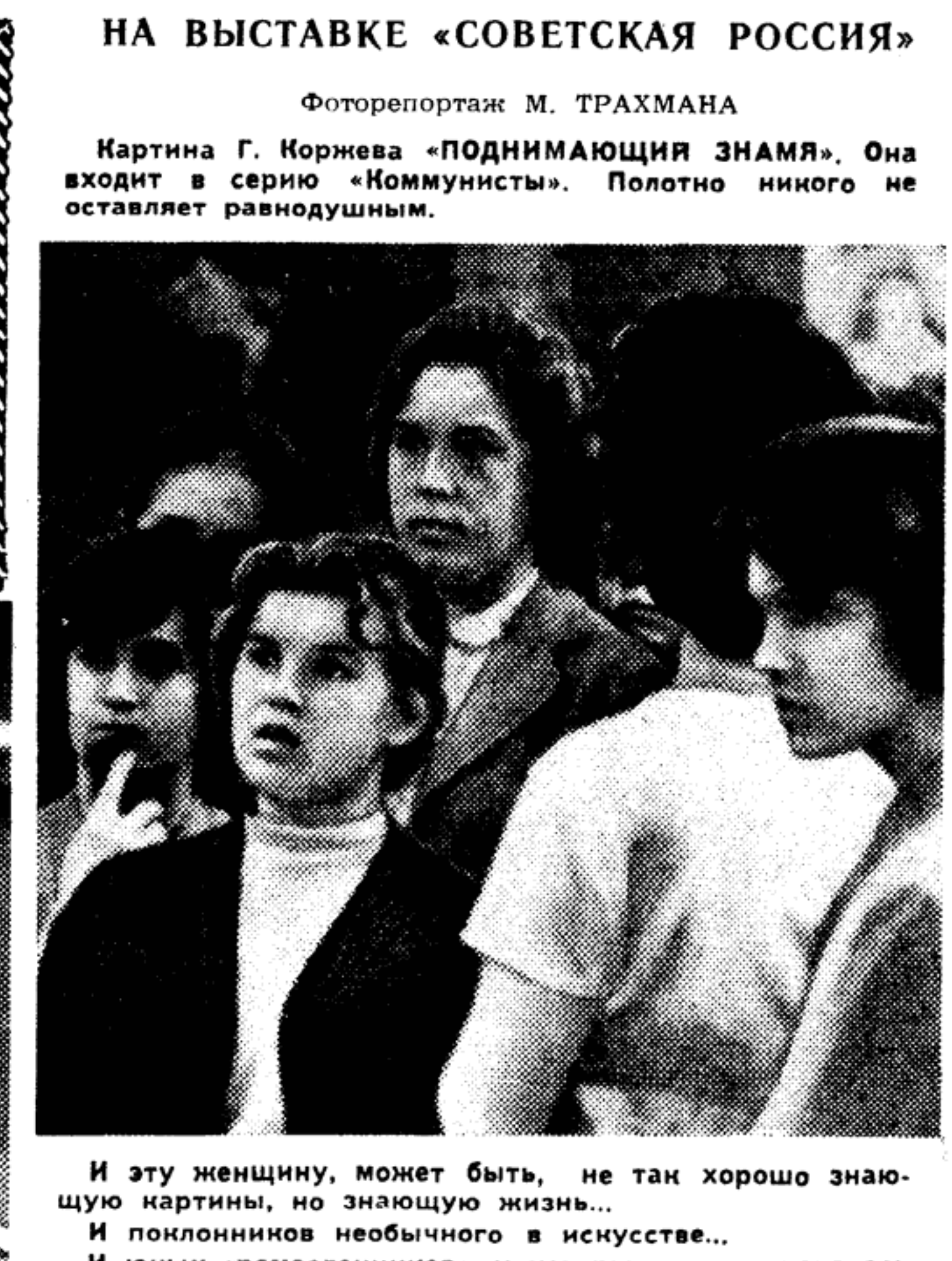
И эту женщину, может быть, не так хорошо знающую картину, но знающую жизнь... И юных «ремесленников», у которых только началось порою первых выводов.